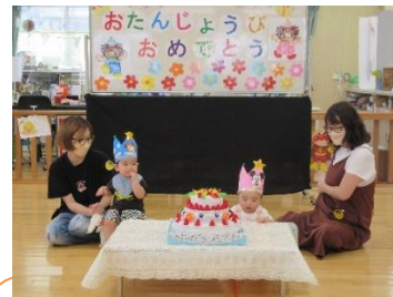
誕生会 10月生まれの誕生会が行われました。1歳になったお友だち。冠も気に入ったようで、みんなにお祝いしてもらいました。