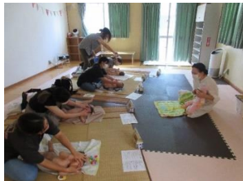
ベビーマッサージ ベビーちゃんとコミュニケーションをとりながら、集中してマッサージに取り組んでいました。