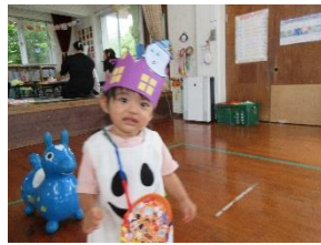
ぴっぴのお友だちと一緒に児童館のハロウィンに参加してきました。