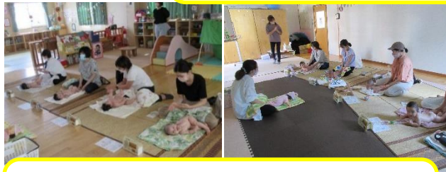
月1回行われるベビーマッサージ。今月は、先生の都合で2回行いました。穏やかな雰囲気、親子のコミュニケーションを楽しみました。