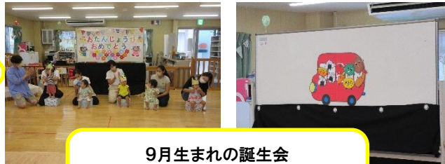
9月生まれの誕生日会 5名の9月生まれのお友だちをたくさんのおともだちがお祝いました。