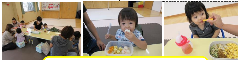
お弁当会 お子さんの食事の悩みはつきないもの。家とは違う雰囲気の中でお友だちと一緒にお弁当会を楽しみました。