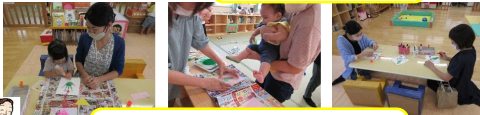
敬老の日に向けて、親子製作をしました。ベビーちゃんは足形、キッズは手形を取り、ママたちがきれいに花飾りをつけて祖父母へのプレゼント作りをしました。