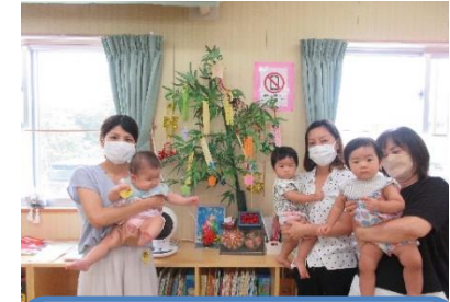
七夕の日。短冊にはお子さんの成長を願って、たくさんのお願い事が書かれていました。

暑中お見舞い申し上げます。夏休み真っ最中。今年の夏は猛暑で、日差しが強い日が続いています。しっかり食べて休息をとりつつ、夏の暑さに負けずに元気に過ごしたいですね。こまめな水分補給で熱中症対策も忘れずに。水遊びなどが楽しい夏ですが、暑さが厳しく疲れが出ることが多くなる季節でもあります。無理をしないように夏ならではの遊びを楽しみたいと思います。