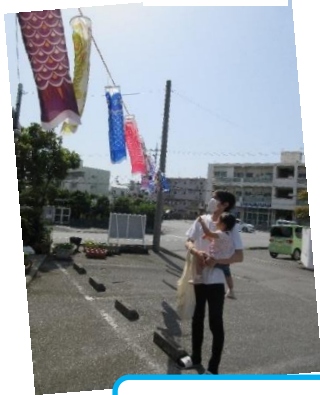
こいのぼり掲揚 こいのぼり製作