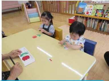
壁面製作「チューリップ」シールをペタペタ、チューリップのお花ができました。