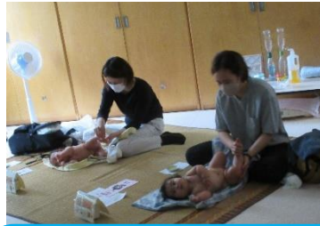
ベビーマッサージ 夏の紫外線が強い日は、クーラーの効いた室内で過ごすので乾燥しやすく保湿が必要だそうです。