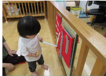
あたらしいおもちゃ月