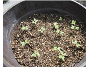
種を植えました。芽ができました。なんのお花が咲くのかな？お楽しみに～♪