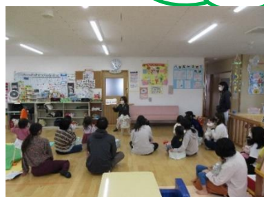
読み聞かせ再スタートしました