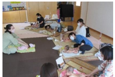
ベビーマッサージ。泣いたり笑ったり、気持ちよくて眠ったり、いろいろな表情を見せてくれたベビーちゃん達でした。癒しの時間をありがとう。

新年度のスタートです。保育園、こども園に入園される皆さんおめでとうございます。新しい生活にどきどきワクワクですね。ぴっぴでも新年度スタートです。今年度もたくさんの親子が心地良く利用できるよう職員一同新たな気持ちでかかわっていきたくと思います。今年度もぴっぴをよろしく願います。今月は、親子でこいのぼり製作を計画しています。