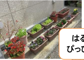
はるですね～♪はるですよ～♪ ぴっぴにもたくさんのお花が咲いてます。