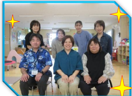
令和4年度、職員7人で頑張ります。よろしくお願いします。

新しい年度のスタートです。保育園、こども園、幼稚園などに入園される皆さんおめでとうございます。新しい生活にどきどきわくわくですね。ぴっぴでも職員が増えて、新しい風に包まれて新年度をスタートしました。これから初めてぴっぴを利用しようと思っいらっしゃる方、継続してぴっぴを利用している皆さん、遊びに来て下さいね。ぴっぴで待っています