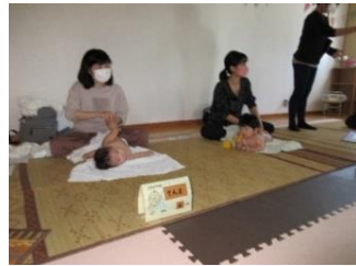
ベビーマッサージ