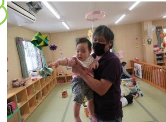
お父さんと一緒に♪ た〜くさん遊んだよ〜