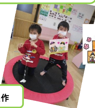
ぴっぴで一緒になったお兄ちゃんに優しくしてもらい、後を追いかけるように「あそんで～」と誘っていました。