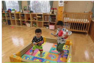
久しぶりに遊びに来てくれたお友だち。弟くんはお兄ちゃんの真似をしてエイサーを踊りながら楽しんでいました。