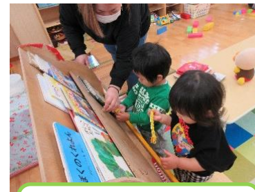
お友だちと一緒に・・・へびさん、穴に入るかな？