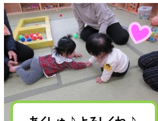
あくしゅ♪よろしくね♪