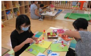
敬老の日の製作 子どもの手や足形をとり、メッセージを書いて壁掛けを作りました。