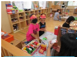
マックごっこ遊び

少しずつ涼しくなり、だんだんと秋の気配を感じる季節となってきました。長い自粛で、久しぶりに子どもたちの笑い声や笑顔が見られて、とてもうれしく感じました。今月5日(月)からは、通常通り予約なしで利用できるようになりました。換気、密に気を付けながら、安心できる場所を提供していきたいと思えます。今月は、ハローウィンの製作も予定していますので、ぜひ、ぴっぴに遊びに来てください。