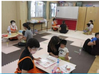
沖縄県歯科衛生士会による歯と口の健康講座。8組の親子が参加してくれました。子供のむし歯についてと歯磨きの仕方を習いました。

歯の本数を考えがちですが、歯はあごの骨とともに成長します。歯の育ちはあごの育ちを支え、全身の発達に深く関わっているそうです。