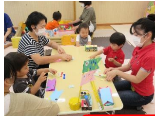
親子こいのぼり製作