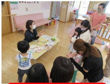
栄養士による食育講座