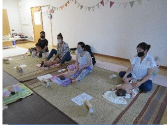
ベビーマッサージ