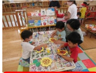
ひまわり壁面製作