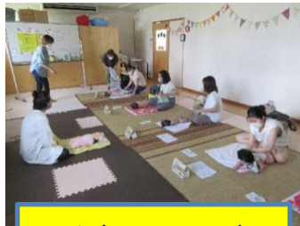
ベビーマッサージ