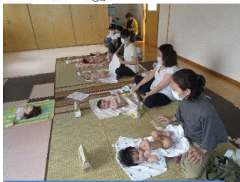
ベビーマッサージ