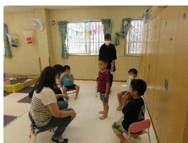
フルーツバスケット