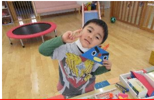
おにのおめん作り