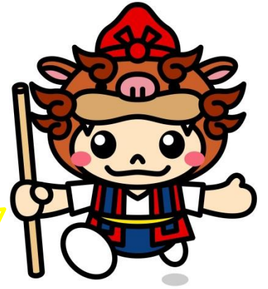
やえせのシーちゃん

今年度も新型コロナウイルスの影響が大きかった一年でした。利用者の皆様には、利用制限や感染拡大防止にご協力してもらいながらぴっぴを利用していただきありがとうございました。一年ってあっという間で、ハイハイしていたお友だちがあんよができるようになったり、指差しや喃語で伝えていたことがおしゃべりできるようになったり、子どもやパパママのたくさんの笑い声、お子さんの日々の成長の瞬間がとても楽しく微笑ましい一年でした。また、来年度もよろしくお願いいたします。