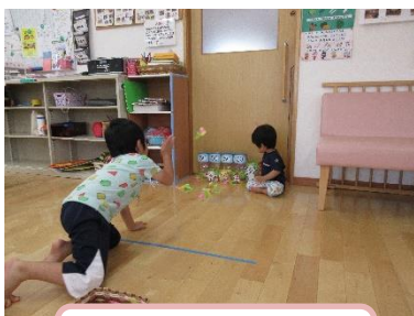
キャップ投げゲーム