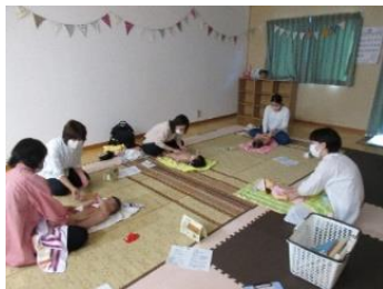
ベビーマッサージ