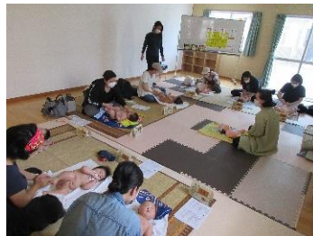
ベビーマッサージ