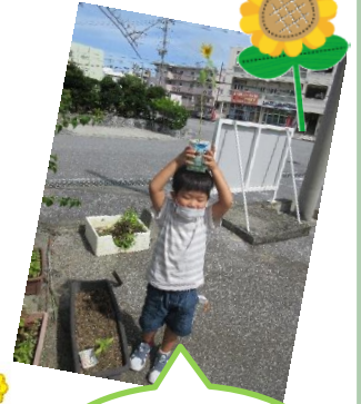
ひまわり咲いたよ♪